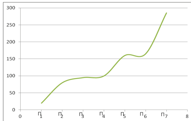
Рис. 2. График работы алгоритма отказоустойчивости

Ниже на рисунке 2 по оси X отображены процессы, а по оси Y отображено время в секундах выполнения процессов.