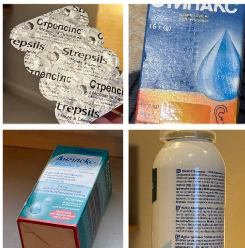
Рисунок 3 – Приклади відблисків та локальної втрати читабельності тексту на упаковках лікарських засобів

У випадку упаковок лікарських засобів проблема відблисків поєднується зі складною геометрією поверхонь, дрібним шрифтом та неоднорідним освітленням, що додатково знижує стабільність AI-розпізнавання. Тому контроль умов освітлення та мінімізація світлових артефактів є важливими елементами підвищення якості автоматизованого аналізу фармацевтичних упаковок.