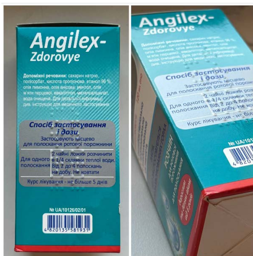
Рисунок 2 – Вплив кута зйомки на геометричне спотворення тексту на упаковках лікарських засобів

Окрему складність створює поєднання криволінійної геометрії з дрібним шрифтом та щільним розташуванням інформації. У подібних випадках навіть незначне розмиття або зміна кута зйомки може призводити до втрати читабельності окремих фрагментів тексту. Приклад впливу кута фотографування на деформацію текстових елементів наведено на рисунку 2.