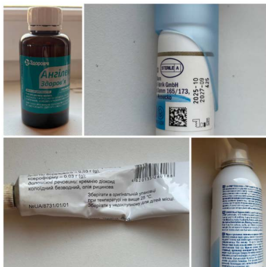
Рисунок 1 – Приклади деформації тексту на циліндричних та криволінійних поверхнях упаковок лікарських засобів

Під час фотографування циліндричних або вигнутих поверхонь текстові елементи зазнають нелінійної проєкційної деформації. Символи, розташовані ближче до країв упаковок, можуть візуально стискатися, викривлятися або частково виходити із зони чіткої видимості. Приклади деформації тексту на криволінійних поверхнях упаковок наведено на рисунку 1.